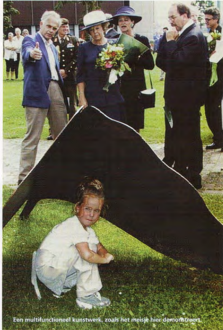
Een multifunctioneel kunstwerk, zoals het meisje hier demonstreert.

"Nee (gedecideerd). Wel als iemand met wie je kan praten over het vak, maar niet echt als een mede-beeldhouwer. Toen ik haar voordroeg voor het ere-lidmaatschap van de Nederlandse Kring van Beeldhouwers was dat niet wegens haar hobby, maar voor