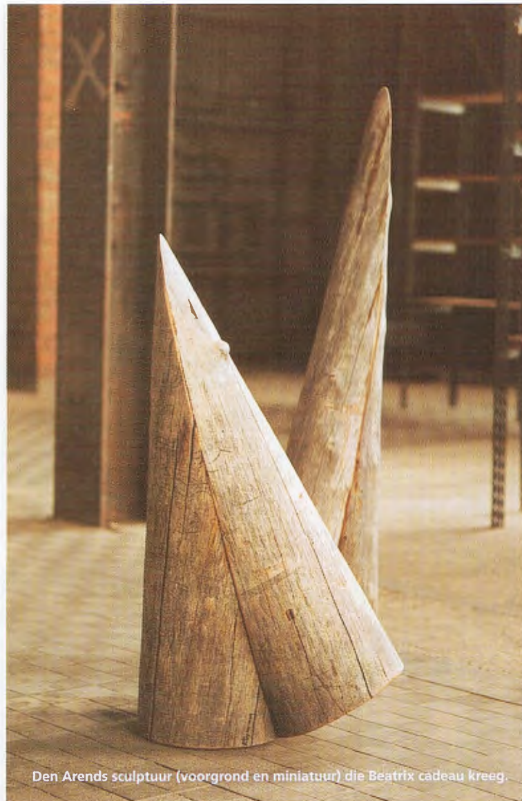
Den Arends sculptuur (voorgond en miniatuur) die Beatrix cadeau kreeg.

Een andere keer kwam ze naar de Hollandsche Biesbosch