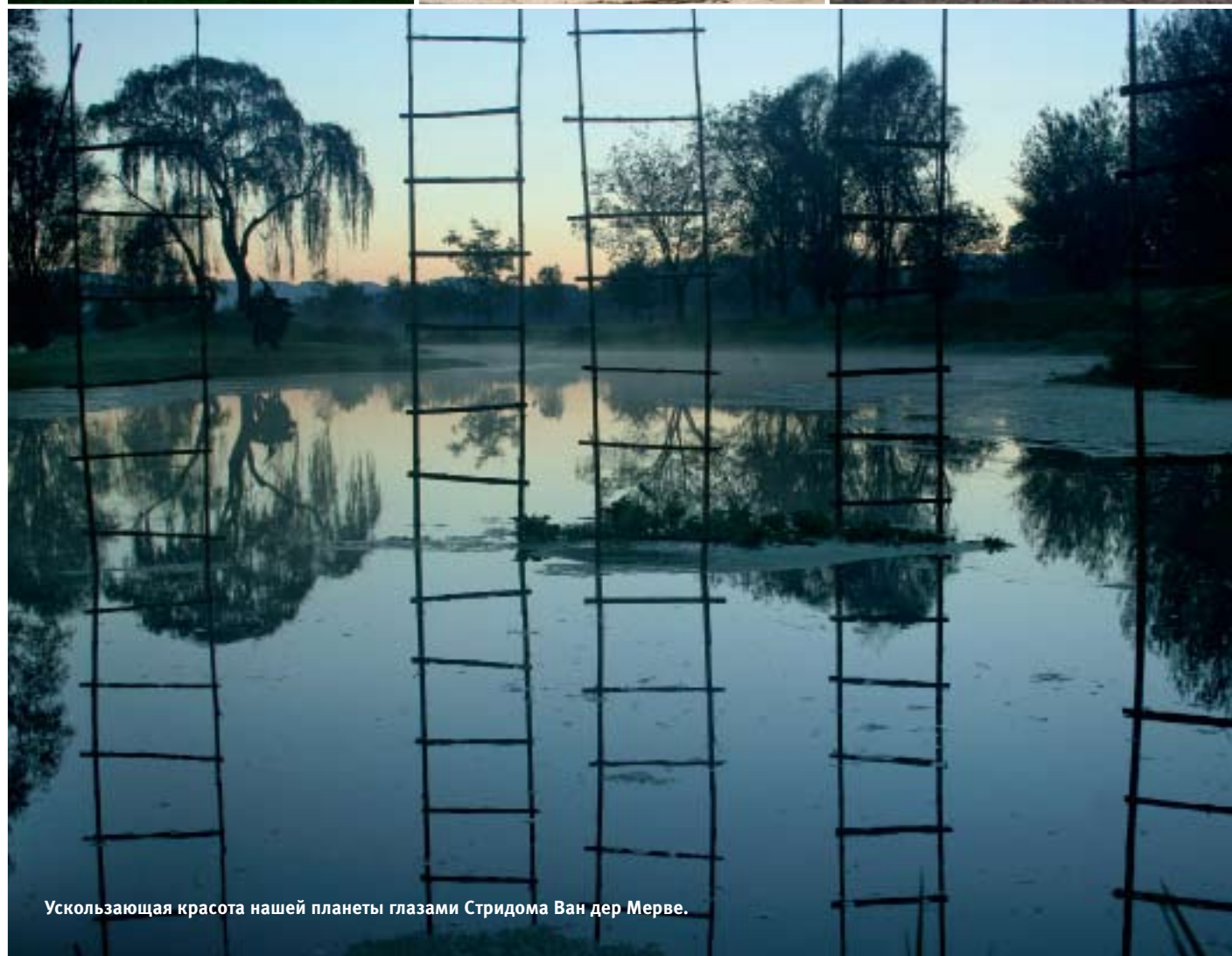
Ускользящая красота нашей планеты глазами Стридома Ван дер Мерве.

придуманные им «Светящиеся поля» (действуют до сих пор) в штате Нью-Мексико представляют собой сетку шестиметровых столбов, которые во время грозы притягивают к себе молнии. Первый пример более показателен для времен зарождения лэнд-арта, второй – для того, чем лэнд-арт стал сейчас. Но в любом случае оба проекта воплотили в себе несколько главных принципов этого направления – зрелищность, масштаб, красоту и полное отсутствие какой-либо практической ценности.